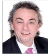
Thomas Makowski Cantel (Germany) GmbH, Düsseldorf